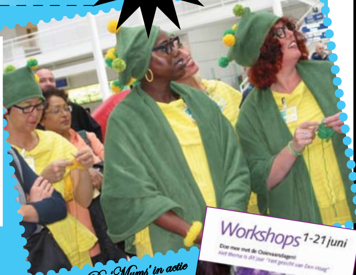
De 'Mums' in actie

Grafische Werkplaats PRINTS // Zeefdrukken Vrije Academie // Digitaal Printen Koorenhuis // Video Kees Fluitman // Schilderen Kinderkunstcentrum BarioK // Poppenspel Stichting Haags Kinderatelier // Haagse burgers van vroeger + Herenhuis ontwerpen en maken + Dieren maken + Poppen maken + Arbeiderswoning ontwerpen en maken