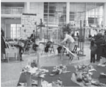
△ Ooievaarsdagen 2003.

Zelf video's monteren, zeefdrukken, schilderen of poppen maken - tijdens de Ooievaarsdagen in juni kan iedere Hagenaar voor een prikje zelf met kunst en cultuur aan de slag. Het thema van de ooievaarsdagen dit jaar is 'het gezicht van Den Haag!'. De Ooievaarsdagen duren dit jaar van 1 juni tot 2 juli. In die maand zijn er workshops op locatie, een informatiemarkt op 23 juni in de bibliotheek en een tentoonstelling in het Atrium van het stadhuis. Start van de workshops is 1 juni. De prijzen zijn laag, maar Ooievaarspashouders krijgen ook nog speciale kortingen. Iedereen kan zich aanmelden voor een cursus of workshop. Voor informatie of inschrijving: Voeten en Vleugels dagelijks tussen 14.00 uur en 16.00 uur, Bonny van der Burg, (070) 305 04 87 of bonny@voetenenvleugels.nl . Het programma van de Ooievaarsdagen staat op www.voetenenvleugels.nl .